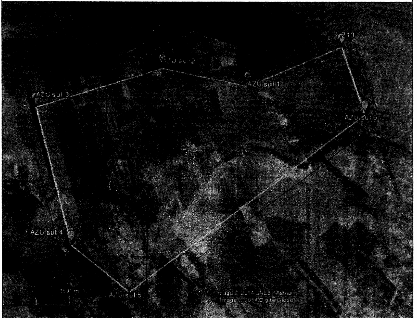
IMAGEM ZONA URBANA IGUATU AMPLIAÇÃO SUDOESTE